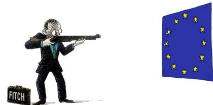
Les « tontons flingueurs » de la finance internationale

Nous avons pu voir depuis quelques mois des équipes très en forme. La Grèce tout d'abord, avec son lot de réductions salariales et l'augmentation des annuités pour la retraite, suivi de près par le Portugal, l'Espagne et l'Italie. Autres équipes qui confirment leur appétence pour le moins social, l'Allemagne et l'Angleterre qui placent la barre des réductions budgétaires à un niveau jamais atteint. La France quant à elle, elle refait son